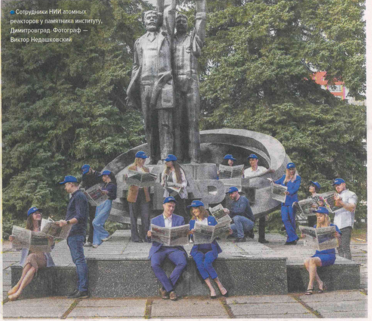
● Сотрудники НИИ атомных реакторов у памятника институту, Димитровград.